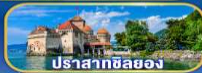
ปราสาทซิลยอง