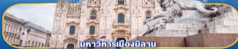
มหาวิหารเมืองมิลาน