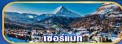
เซอรัมเมท