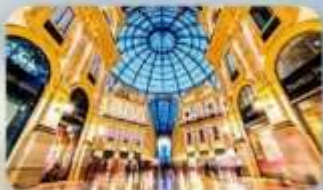
ซ็อบบิงจัดเต็มที่ MILAN