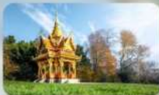
ชมความงามเมืองโลซานน์