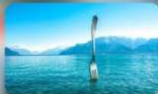
ทะเลสาบเจนีวา