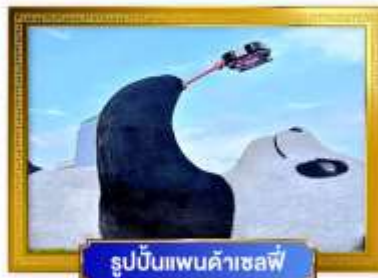
รูปปั้นแพนด้าเซลฟี