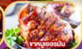
ซากหมูเยอรมัน

พิเศษ!! เมนูหอยแมลงภู่อบไวน์ขาวและซากหมูเยอรมัน