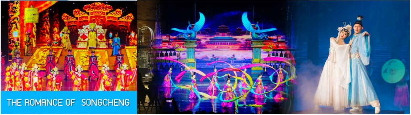
THE ROMANCE OF SONGCHENG