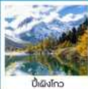
ปี้ผิงโกว