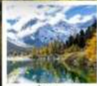
ปี้ผิงโกว