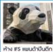
ห้าง IFS แพนด้าปิ่นตึก