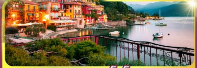
ทะเลสาบโลโบ