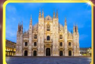
มหาวิหารแห่งเมืองมิลาน