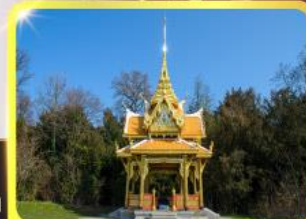
ศาลาไทยไชยาน์