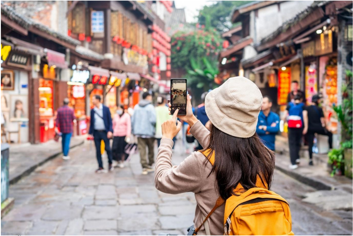
จากนั้น ออกเดินทางสู่ มหานครฉงชิ่ง (ใช้เวลาเดินทางประมาณ 2 ชั่วโมง)