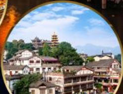
เมืองโบราณฉือจี้โซ่ว