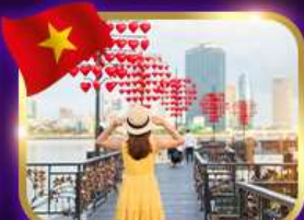
เช็คอินสะพานแห่งความรัก