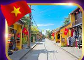
เมืองเก่ามรดกโลก ฮอยอัน