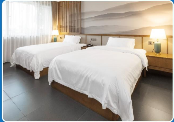
👤👤 TWIN (TWN)