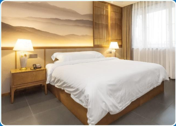
👤 SINGLE (SGL)