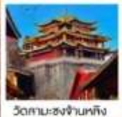
วัดสาม-ซงจ้านหลิง