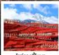
ไร่ชาฉือหนิว

พิเศษ!! รวมค่าเช่าชุดพื้นเมือง ...ที่เมืองโบราณลี้เจียง