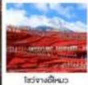
ไร่ชางอีหมว