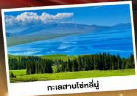
ทะเลสาบไซทาลู

ชมวิวดอกคังการแบบยุโรปผสมเอเชีย กุ้งหนุ่ยานาราตี ทะเลสาบสีเทอร์ควอยซ์