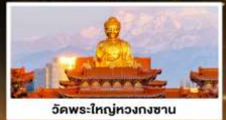
วัดพระใหญ่หวงกงซาน