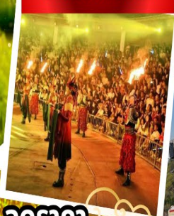
ปาร์ตี้รอบกองไฟ