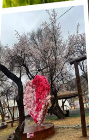
สวนแอปริคอต