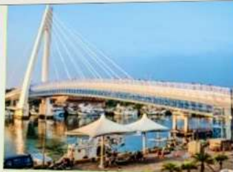
สะพานคู่รักตั้นส่วย