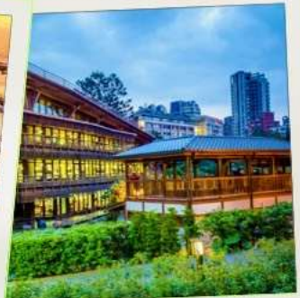
ห้องสมุดเป่ย์โถว