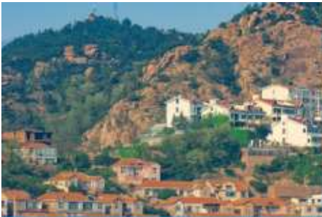
หมู่บ้านซาจื่อโข่ว

จากนั้นนำท่าน เดินทางสู่ คาเฟ่อัสดง 落日古堡 นำท่านชมปราสาทในเทพนิยาย ที่ตั้งตระหง่านอยู่ริมชายหาด นานาชาติเวทย์ให้ คาเฟ่ที่ออกแบบด้วยสถาปัตยกรรมสไตล์ยุโรป ตัดกับวิวทะเลสีคราม และที่นี่คือแม่เหล็กดึงดูดนักท่องเที่ยวมาเก็บบรรยากาศความสวยงามความโรแมนติก (ตัวปราสาทเป็นร้านกาแฟ หากท่านต้องการเข้าไปด้านใน ต้องจ่ายค่าเครื่องดื่ม ตามเมนูของทางร้าน ซึ่งไม่รวมในอัตราค่าทัวร์)