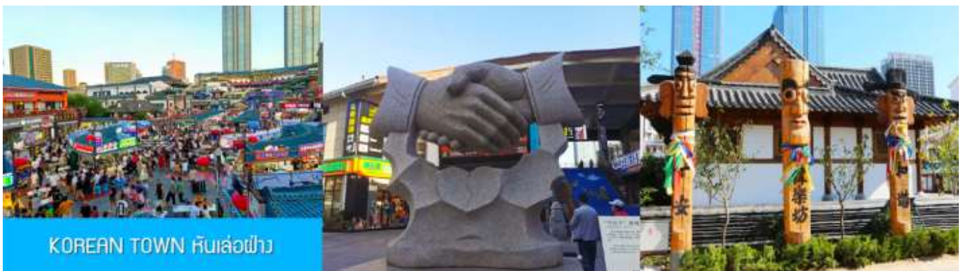
KOREAN TOWN หันเล่อฝาง