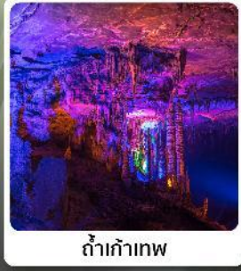
ถ้ำเก้าทง