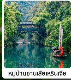
หมู่บ้านซานเสี่ยเหรินเจีย