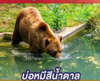
บ่อหมีสีน้ำตาล