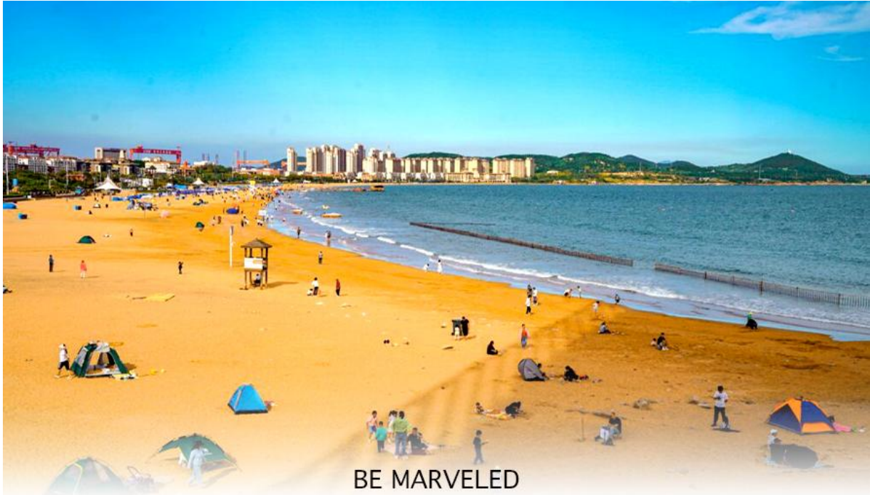
BE MARVELED หาดจินซาตาน

และชม หาดจินซาตาน ตั้งอยู่ในเขตหวงเต่า ของเมืองชิงเต่า มณฑลซานตง เป็นชายหาดที่ใหญ่ที่สุดและสวยที่สุดแห่งหนึ่งในเมืองชิงเต่า มีชื่อเสียงจากเม็ดทรายที่ละเอียดและมีสีเหลืองทองระยิบระยับ น้ำทะเลใสสะอาดและมีกิจกรรมหลากหลาย เช่น ว่ายน้ำ วอลเลย์บอลชายหาด และเครื่องเล่นทางน้ำ มีการจัดเทศกาลวัฒนธรรมและการท่องเที่ยวหาดทรายทองเป็นประจำทุกปีในช่วงฤดูร้อน