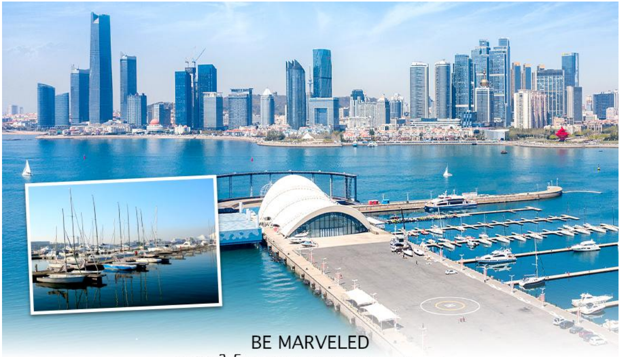
BE MARVELED ศูนย์เรือใบโอลิมปิก และบริเวณ Wasu Square

จากนั้นนำท่านไป ถนนคนเดินสไตลเยอรมัน การผสมผสานของวัฒนธรรมจีนและเยอรมันเหมือน เดินเล่นอยู่ในยุโรป บรรยากาศดี คึกคักโดยเฉพาะช่วงเวลากลางคืน สามารถช้อปปิ้ง ถ่ายรูปเล่นได้