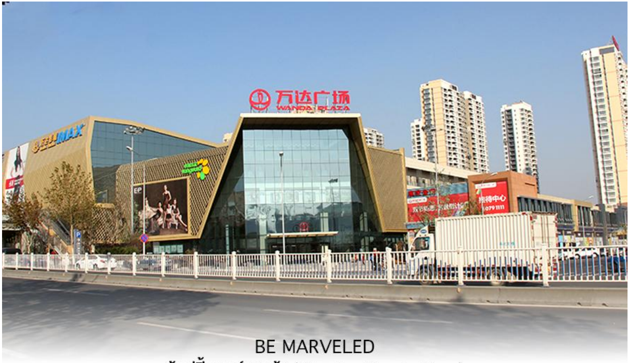
BE MARVELED ช้อปปิ้งศูนย์การค้า (Qingdao Wanda Plaza)

ที่พัก HOLIDAY INN EXPRESS QINDAO หรือเทียบเท่าระดับ 4 ดาว