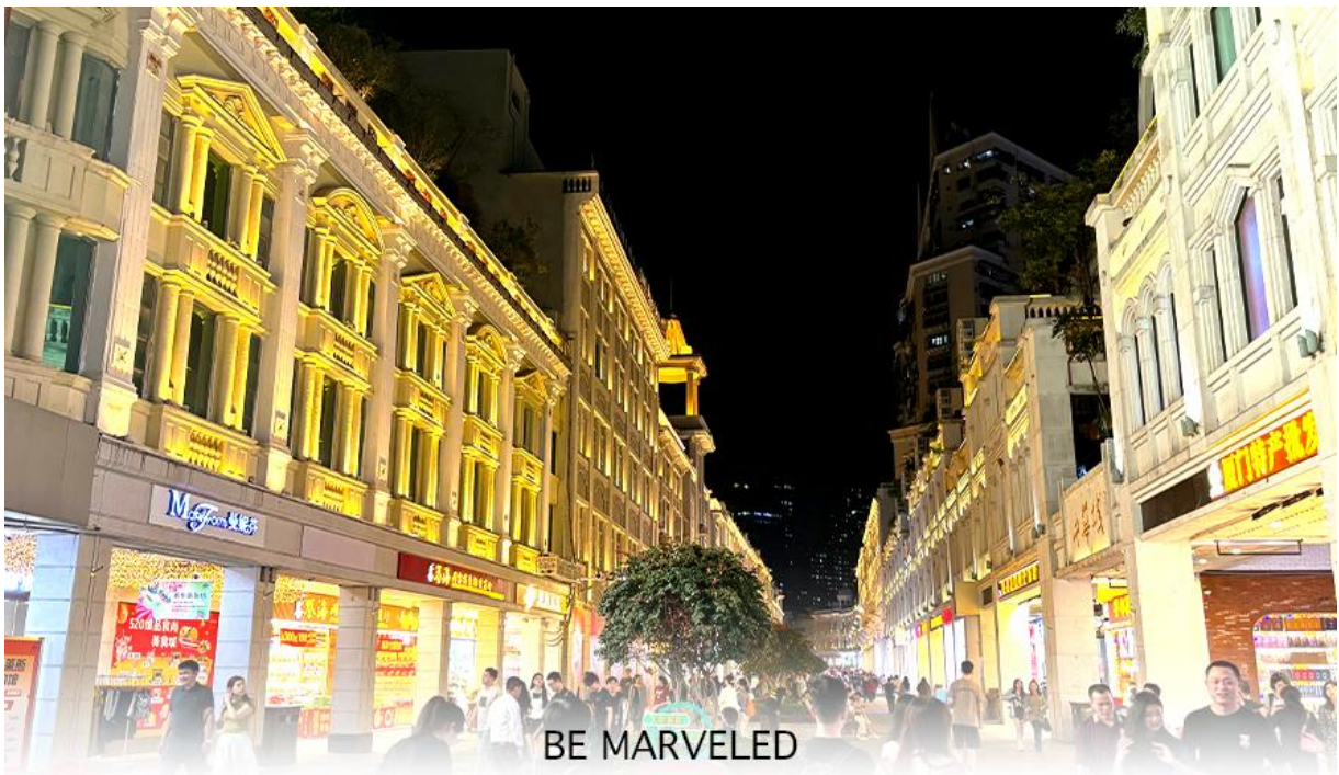
BE MARVELED ถนนคนเดินจงซานหลู่

จากนั้นนำท่านเดินทางไป ถนนคนเดินจงซานหลู่ เป็นถนนการค้าเก่าแก่ที่มีชื่อเสียง เป็นศูนย์กลางแฟชั่นและย่านช้อปปิ้งสำคัญของเมือง นอกจากนี้ ยังมี "สวนจงซาน" (Zhongshan Park) ซึ่งเป็นสวนสาธารณะขนาดใหญ่ใจกลางเมือง