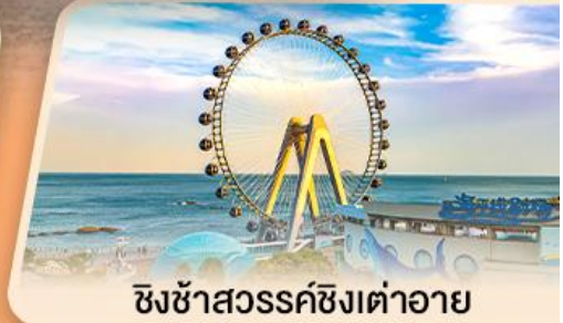
ชิงช้าสวรรค์ซิงต้าอายุ