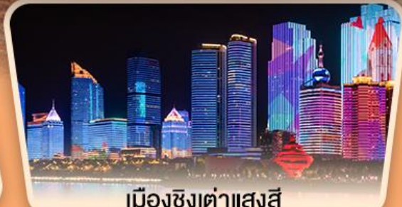
เมืองซิงต้าแสงสี