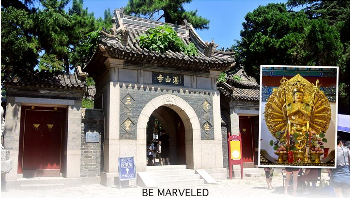
BE MARVELED วัดจันซาน

เมืองชิงเต่า สถานที่ที่สงบ และบรรยากาศภายในวัดที่ร่มรื่น ตั้งอยู่เหนือเนินเขาจากสวนสาธารณะ จงซาน ก่อตั้งในปี พ.ศ. 2477 เป็นวัดอายุน้อยที่สุดในนิกายเถียนโถของพุทธศาสนาจีน แต่โดดเด่น ด้วยสถาปัตยกรรมและคุณค่าทางวัฒนธรรม