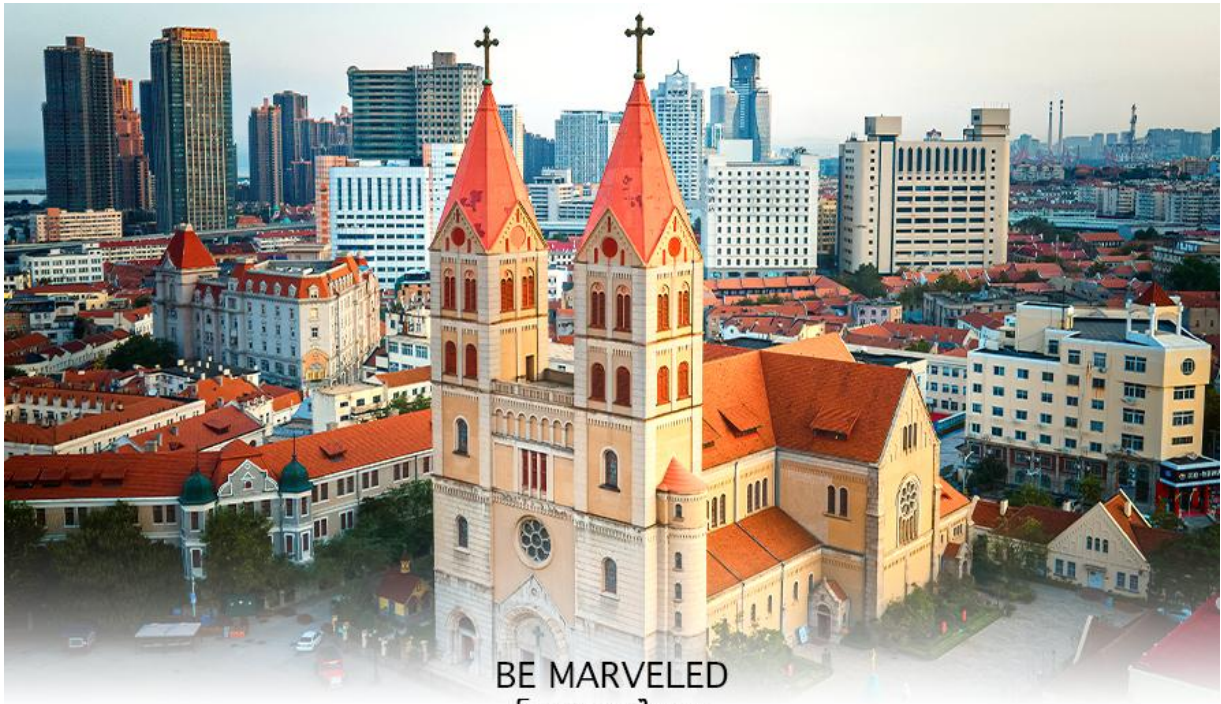
BE MARVELED โบสถ์เซนต์ไมเคิล