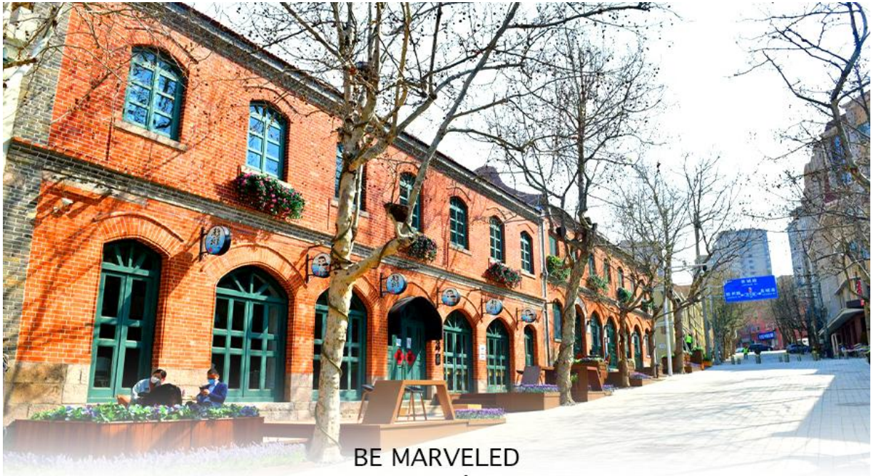
BE MARVELED ย่านวัฒนธรรมต้าป้าวเต๋า

จากนั้นนำท่านเดินทางไป ถนนคนเดินจงซานหลู่ เป็นถนนการค้าเก่าแก่ที่มีชื่อเสียง เป็นศูนย์กลางแฟชั่นและย่านช้อปปิ้งสำคัญของเมือง นอกจากนี้ ยังมี "สวนจงซาน" (Zhongshan Park) ซึ่งเป็นสวนสาธารณะขนาดใหญ่ใจกลางเมือง