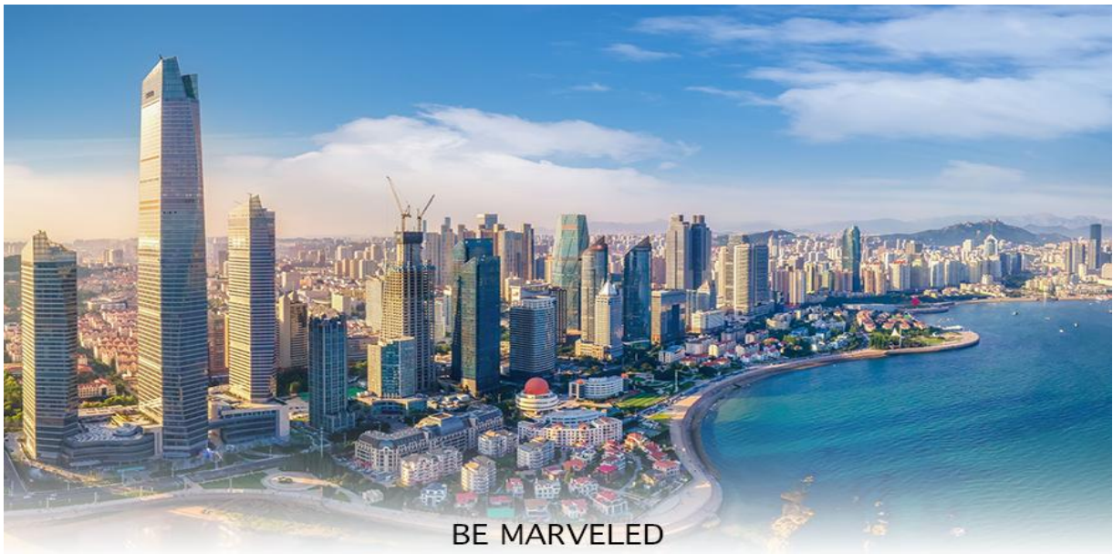
BE MARVELED เมืองชิงเต่า

02.25 น. ออกเดินทางสู่ สนามบินชิงเต่า โดยสายการบิน Shandong Airlines (SC) เที่ยวบินที่ SC4080 บริการ SNACK บนเครื่อง 07.58 น. เดินทางถึง สนามบินชิงเต่า เมืองชิงเต่าเป็นเมืองชายทะเลที่ตั้งอยู่ทางตอนใต้ของมณฑลซานตง ประเทศจีน มีชื่อเสียงจากบรรยากาศที่ผสมผสานระหว่างสถาปัตยกรรมสไตล์ยุโรปสมัยอาณานิคมกับความทันสมัยของจีนอย่างลงตัว เมืองนี้เป็นเมืองที่รู้จักในฐานะบ้านเกิดของเบียร์ชิงเต่า (Tsingtao Beer) ที่มีชื่อเสียงระดับโลก