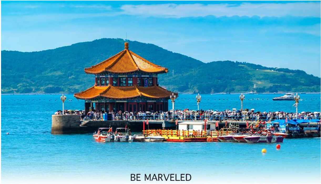
BE MARVELED สะพานจันเจียว

จากนั้นนำท่านเดินทางไป สะพานจันเจียว (Zhanqiao Pier) สะพานนี้สร้างขึ้นในสมัยราชวงศ์ชิง เมื่อปี ค.ศ. 1892 เพื่อใช้ขนส่งทางทหาร แต่ปัจจุบันกลายเป็นจุดชมวิว และมีการปรับปรุงขยาย สะพานเพิ่มจาก 200 เมตร เป็น 440 เมตร โดยปลายทางของสะพานเป็น ศาลาหุยหลาน (Hui Lan Ge) ทรงแปดเหลี่ยม 2 ชั้น คลุมด้วยกระเบื้องเคลือบสีสังกะสี ภายในมีบันไดวน 34 ขั้น เมื่อขึ้นไปยังจุดชมวิวที่มองเห็นทะเลทอดยาวสุดสายตา ยังเป็นจุดที่นักท่องเที่ยวนิยมมาชมพระอาทิตย์ขึ้น และพระอาทิตย์ตก