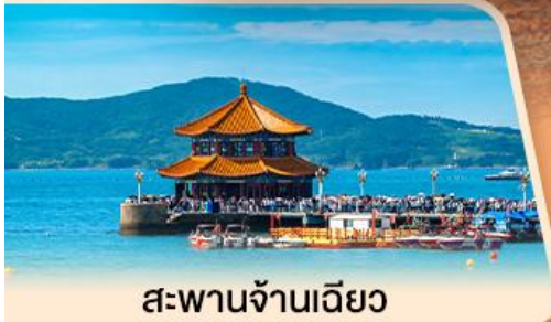
สะพานจันเจียว

ชายหาดซาโจ่ว โรงงานเบียร์ซิงต้า ชมทุ่งดอกพืงค์มอส ชายหาด NO.3