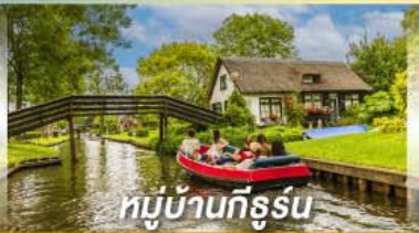
หมู่บ้านทีรูร์น