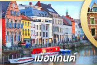
เมืองกันต์