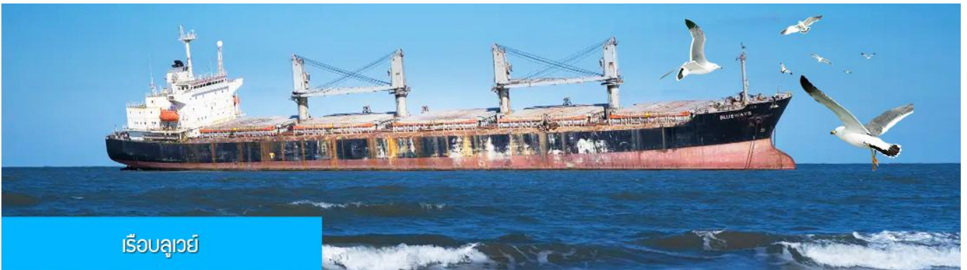
เรือบลูเวย์

เช้า รับประทานอาหารเช้า ณ ห้องอาหารของโรงแรม (7)