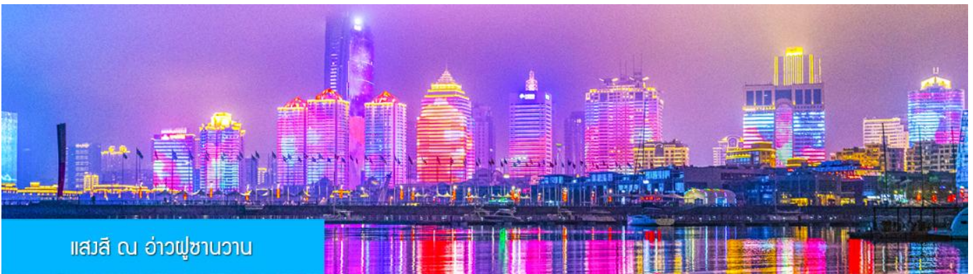
แสงสี ณ อ่าวฟู่ซานวาน