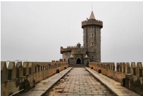
คาเฟ้อสดง