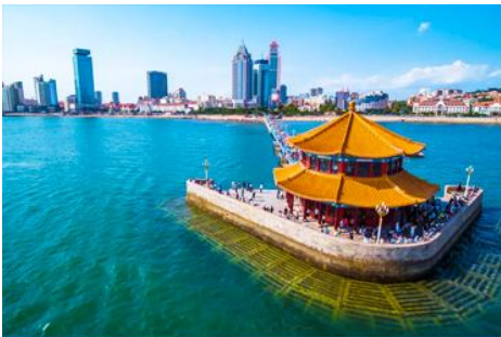
สะพานจ้านเจียว

รับประทานอาหารเช้า ณ ห้องอาหารของโรงแรม (10)