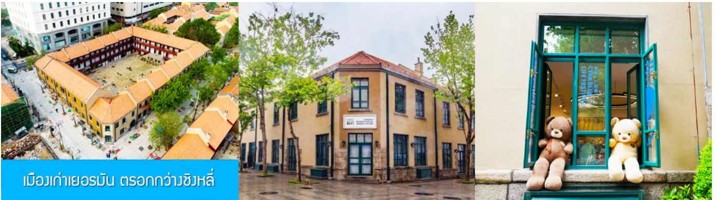
เมืองเก่าเยอรมัน ตรอกกว้างชิงลี่