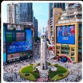
ถนนเจียฟางเป่ย์