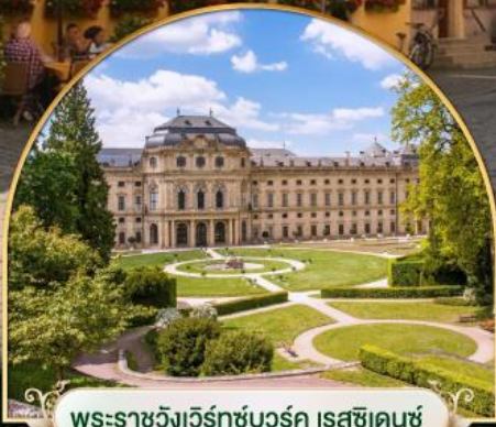
พระราชวังแวร์ซายส์ ฝรั่งเศส