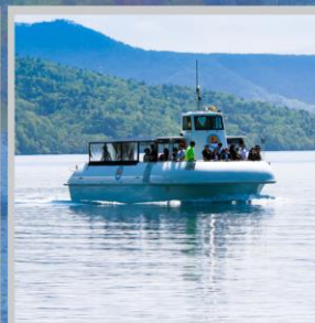
“LAKE SHIKOTSU GLASS BOAT”