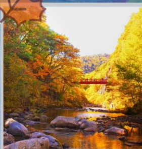
“JOZANKEI FUTAMI BRIDGE”