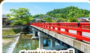
สะพานนากะบาชิ ทาคายาม่า