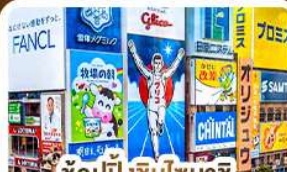
ช้อปปิ้งชินโซบาชิ และโดตงโบริ