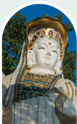
เจ้าแม่กวนอิม ธิพลสภย์