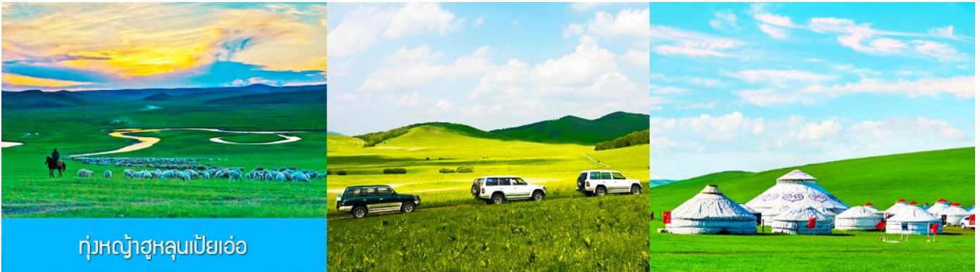
ทุ่งหญ้าฮูลุนเปียวเอ๋อ