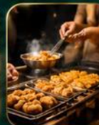
สตรีทฟู้ดชื่อดัง