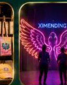
จุดเช็คอินสุดฮิต