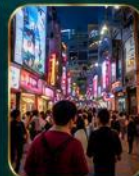
แหล่งช้อปปิ้งแฟชั่นสุดฮิต