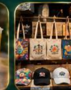
ของฝากเก๋ ๆ