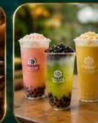
เครื่องดื่มยอดนิยม