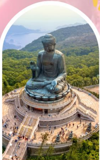
นั่งกระเช้ามองปีง นมัสการพระใหญ่ไป๋หวลิน