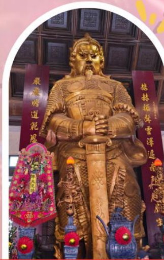
วัดเซกวง ขอพรโชคลาภ การเงิน และธุรกิจ