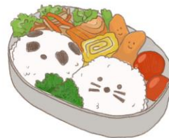
● อาหารสำหรับเด็ก ( 2-11 ปี ) *วัตถุประสงค์ขึ้นอยู่กับทาว์ราน