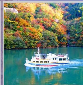
"SHOGAWA YURAN CRUISE"