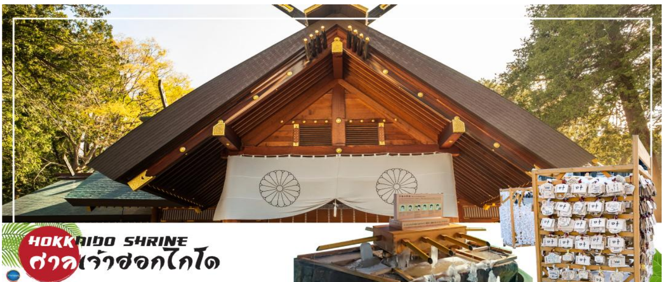
HOKKAIDO SHRINE ศาลเจ้าฮอกไกโด

นำท่านขอพร ศาลเจ้าฮอกไกโด (Hokkaido Shrine) หรือเดิมชื่อ ศาลเจ้าซัปโปโร เปลี่ยนเพื่อให้สมกับ ความยิ่งใหญ่ของเกาะเมืองฮอกไกโด ศาลเจ้าชินโตนี้คอยปกป้องรักษาให้ชนชาวเกาะฮอกไกโดมีความสุขถึงแม้จะไม่ได้มีประวัติศาสตร์อันยาวนาน