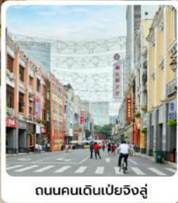
ถนนคนเดินเป่ย์จิงสู๋