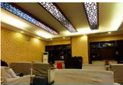
ศูนย์แพทย์แผนจีน

อัตราค่าบริการสำหรับโปรแกรมเสริมการแสดงชุด The love Story of Wooden man and Fairy Fox ท่านละ 400 หยวน (หรือประมาณ 2000.-บาทขึ้นอยู่กับอัตราแลกเปลี่ยน) ระยะเวลาที่ใช้ในการเที่ยวชมการแสดง ประมาณ 3 ชั่วโมง รวมเวลาเดินทางไปกลับค่าบริการรวม ค่าบัตรเข้าชม ค่ารถรับ ส่ง และค่าน้ำทิพย์ของไกด์ท้องถิ่น