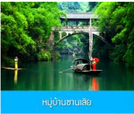
หมู่บ้านชานเสี