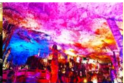
ถ้าเก่าสวรรค์วิวกียนต์

วันที่สาม เมืองจางเจียเจี๋ย-ศูนย์แพทย์แผนจีน -ศูนย์จำหน่ายผลิตภัณฑ์ยางพารา-ถ้าเก่าสวรรค์-อุทยานฟงเหลียนซี-ล่องเรือธารน้ำหมาหยียนเหอ-เมืองโบราณฝูหรงจิน