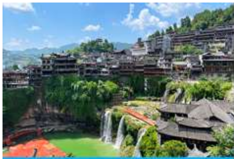
เมืองโบราณ ฝูหรงเจี้ยน