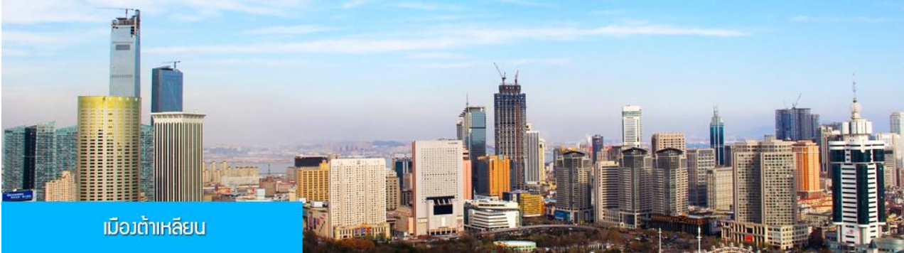
เมืองต้าเหลียน