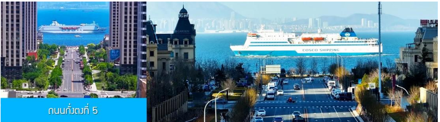
ถนนกังตงที่ 5

หลังอาหารนำท่านเที่ยวชม ถนนกังตงที่ 5 港东五街 จุดเช็คอินใหม่ที่ได้รับความนิยมอย่างสูงจากนักท่องเที่ยวและชาวเมืองต้าเหลียน จุดนี้เป็นช่วงที่ถนนสายกังตงที่ห้า มุ่งตรงสู่ทะเล(มองจากจุดชมวิวที่อยู่ด้านบน) เสมือนว่าปลายทางของถนนไปสิ้นสุดในทะเล อีกด้านจะมองเห็นท่าเรือและอาคารสถาปัตยกรรมตะวันตกเป็นกรอบของมุกกล้องที่งดงาม เมื่อมีเรือแล่นมาผ่านทะเลตรงบริเวณนี้ จะเป็นภาพที่สวยงามและ โรแมนติค