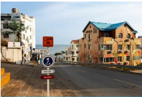
ถนนคบเพลิงหมายเลข 8