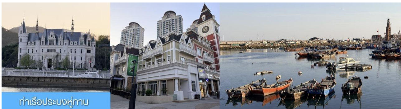
ท่าเรือประมงหู่กาน

พักที่ DALIAN JUZISHUIJING HOTEL / SANSHUI HOTEL โรงแรมระดับ 4 ดาวท้องถิ่น ต้าเหลียน