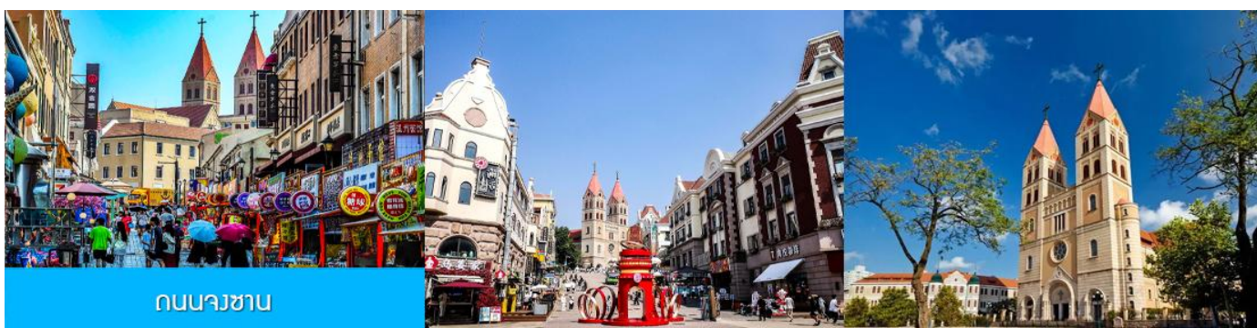
ถนนจงซาน