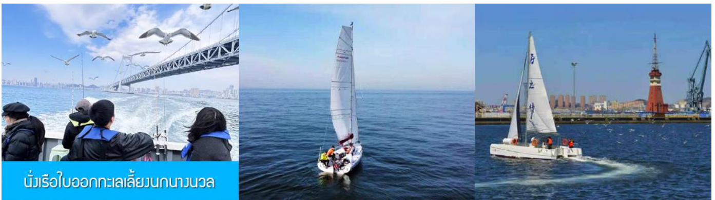
นั่งเรือใบออกทะเลลิ้นกนางนวล