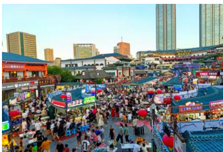
KOREAN TOWN หันล่อฟ้า