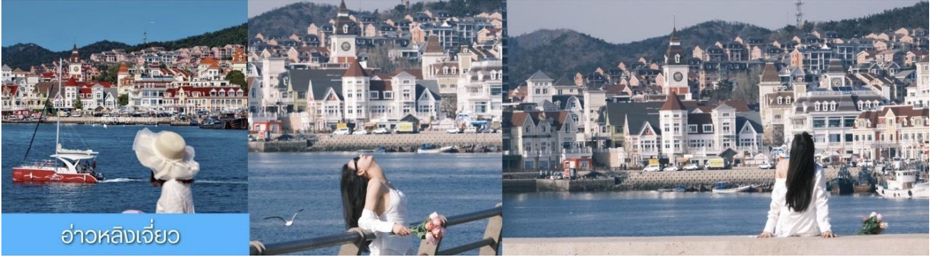
อ่าวหลังเจียว

จากนั้นนำท่าน เที่ยวชม ท่าเรือประมงคู่ทาน 大连渔人码头 เป็นจุดเช็คอินที่โดดเด่นด้วยสถาปัตยกรรมสไตล์ยุโรปสีสันสดใส ผสมผสานกลิ่นอายเมืองท่าดั้งเดิมเข้ากับบรรยากาศสุดโรแมนติคที่เต็มไปด้วยเรือประมง คาเฟ่ ร้านอาหาร และจุดชมวิวยุริมาทะเล