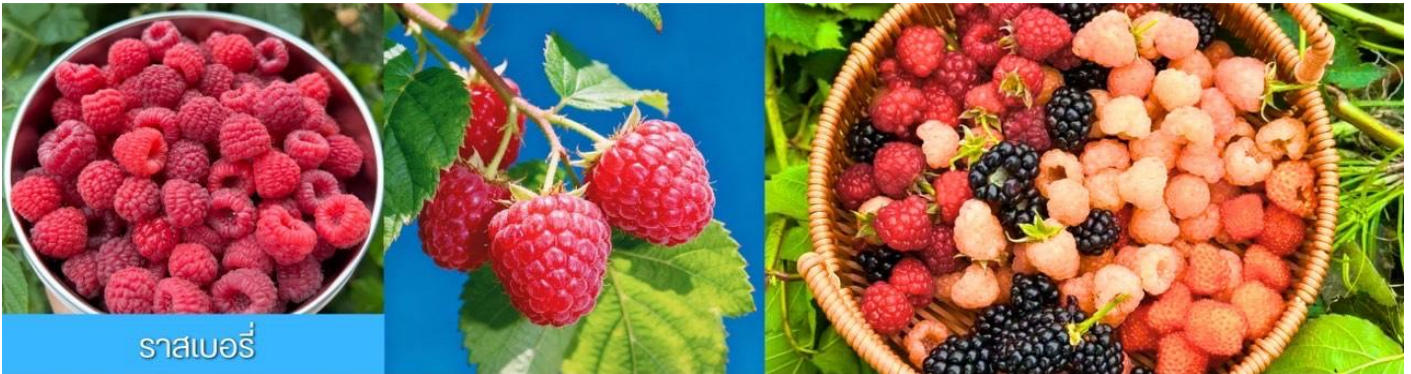
ราสเบอร์รี่