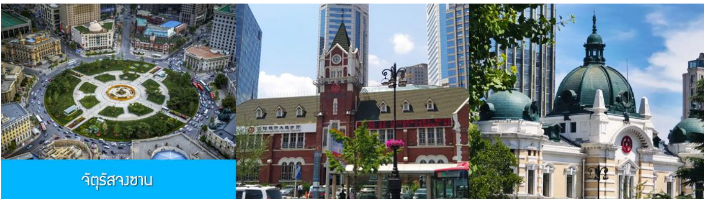
จัตุรัสวงเวียน

จากนั้นนำท่านเที่ยวชม อ่าวหลิงเจี้ยว 菱角湾 เป็นอ่าวธรรมชาติและแลนด์มาร์กถ่ายรูปสุดฮิตในเมืองต้าเหลียน ประเทศจีน โดดเด่นด้วยทิวทัศน์บ้านเรือนสีแสนสดใสเรียงรายริมน้ำ จนได้รับฉายาว่า "Little Santorini แห่งต้าเหลียน" และเป็นจุดชมพระอาทิตย์ตกที่สวยงามมากแห่ง