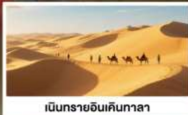
เนินทรายอินเคินกาลา