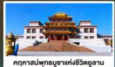
คฤหาสน์พุทธบูชาแห่งชีวิตยูลาน