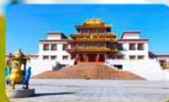
คฤหาสน์พุทธบูชาแห่งชีวีคูลาน