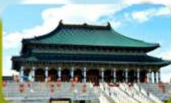
พระราชวังจำลองห้ามอร์ดอส