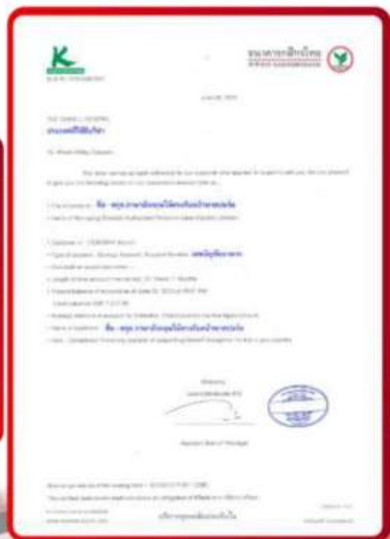
ตัวอย่าง Bank Guarantee ที่ผู้สมัครต้องขอเกี่ยวกับธนาคาร