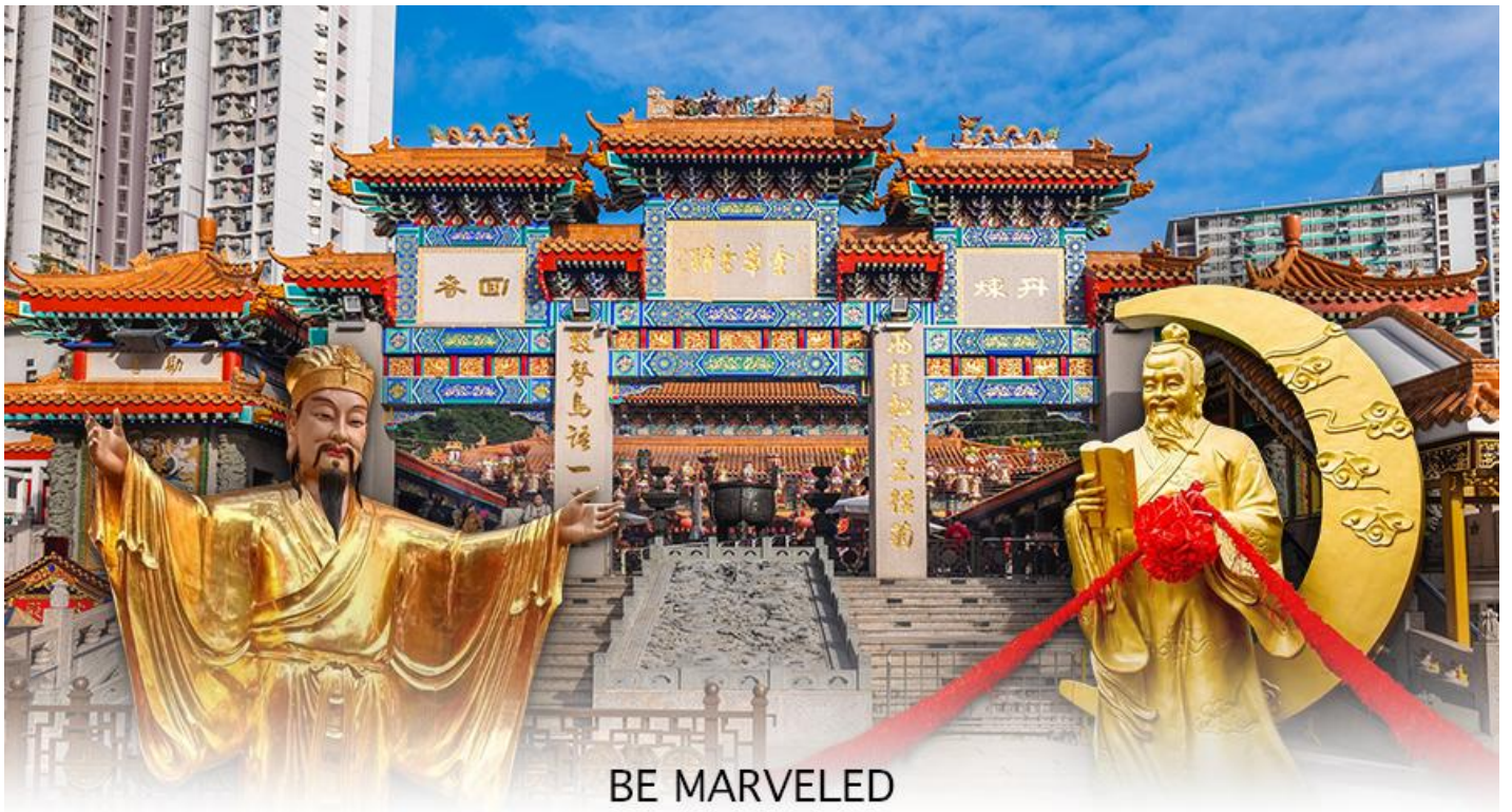
BE MARVELED วัดหว่องต้าเซียน

ให้ วัดหว่องไท่ซิน นั้น มีชื่อเสียงโด่งดังขึ้นมาเพราะ พระหวังต้าเซียน หรือที่รู้จักกันในชื่อ ฮวงซูปิง (Huang Chu-ping) ในช่วงประมาณศตวรรษที่ 4 ได้เดินทางจากเมืองจินมาเผยแผ่ศาสนาในฮ่องกง และสร้างวัดแห่งนี้ขึ้นมาเมื่อประมาณปีค.ศ. 1921 ค่ะ ภายในวัดจะมีทั้ง เทพเจ้าหวังต้าเซียน, เจ้าแม่กวนอิม, เจ้าที่, เทพเจ้าหยุกโหลว (เทพเจ้าแห่งความรัก), ท่านขงจื้อ ซึ่งคนฮ่องกงเอง และนักท่องเที่ยวก็จะมาราบไหว้เพื่อสิริมงคลกัน โดยเฉพาะอย่างยิ่งคือ เทพเจ้าหยุกโหลว หรือ เทพเจ้าแห่งความรัก ที่เราเรียกกันว่า เทพเจ้าด้ายแดง เป็นพิภคที่หลายๆ คนมักจะไปขอความรักจากท่านกัน นอกจากนี้เราจะต้องเอาด้ายแดงมาพันมือนิ้ว ตามป้ายที่แนะนำข้างหน้าแล้ว ใค้ นำเที่ยวคนฮ่องกงบอกว่าถ้าเป็นผู้หญิงอย่างเราอยากได้แฟน ก็ต้องไปผูกด้ายที่รูปปั้นผู้ชายและพอไหว้เสร็จแล้วก็อย่าลืมหยอดทำบุญใส่ตู้ไปด้วย