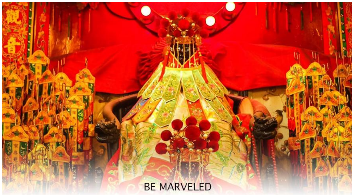
BE MARVELED วัดเจ้าแม่กวนอิมฮวงอ้า (ยิมวิน)

หรือ วันเปิดทรัพย์ เป็นความเชื่อของคนเชื้อสายจีน ทั้งฝั่งฮ่องกง และมาเก๊าถือเป็นพิธีศักดิ์สิทธิ์ในการขอพรเจ้าแม่กวนอิม เชื่อกันว่าเป็นการไหว้และการทำพิธีที่ช่วยเสริมดวงให้เงินทองไหลมาเทมา การขอยืมเงินองค์กวนอิมที่ขึ้นชื่อเรื่องความเมตตา หรือทำการค้า เปิดธุรกิจค้าขายเจริญรุ่งเรือง