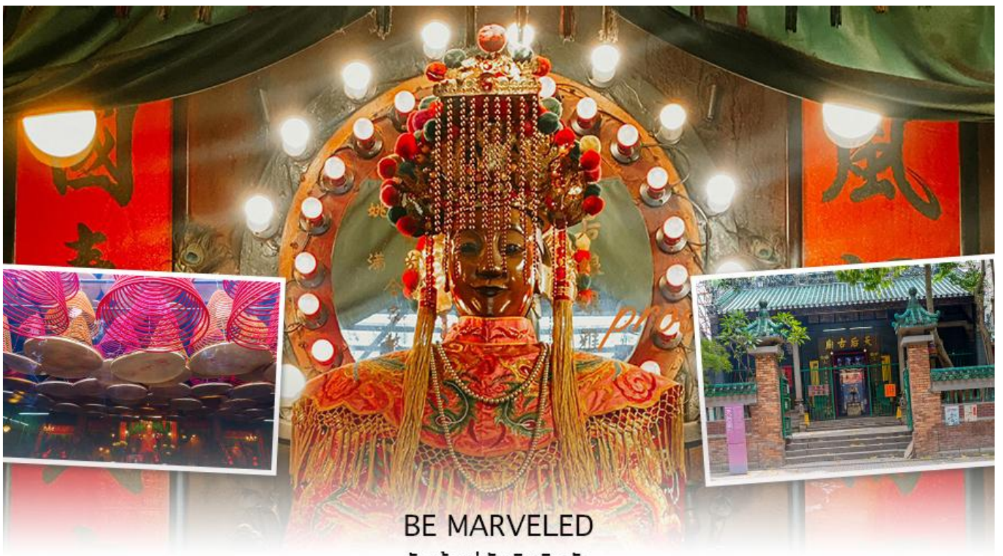
BE MARVELED วัดเจ้าแม่ทับทิมกินหัว

หลังจากนั้นนำทุกท่านเดินทางไปยัง Citygate Outlets เป็นแหล่งรวมร้านค้าตรงจากผู้ผลิตที่ใหญ่ที่สุดในฮ่องกง โดยรวบรวมกว่า 150 แแบรนด์ระดับโลกไว้ในที่เดียว โดยแจกส่วนลดสูงสุด 90% ตลอดทั้งปี แวะช้อปปิ้งแฟชั่นและเครื่องประดับ สินค้าเพื่อสุขภาพและความงาม สินค้าอิเล็กทรอนิกส์ จิวเวลรีและนาฬิกา เสื้อผ้าเด็ก กีฬาและกิจกรรมกลางแจ้ง ฯลฯ