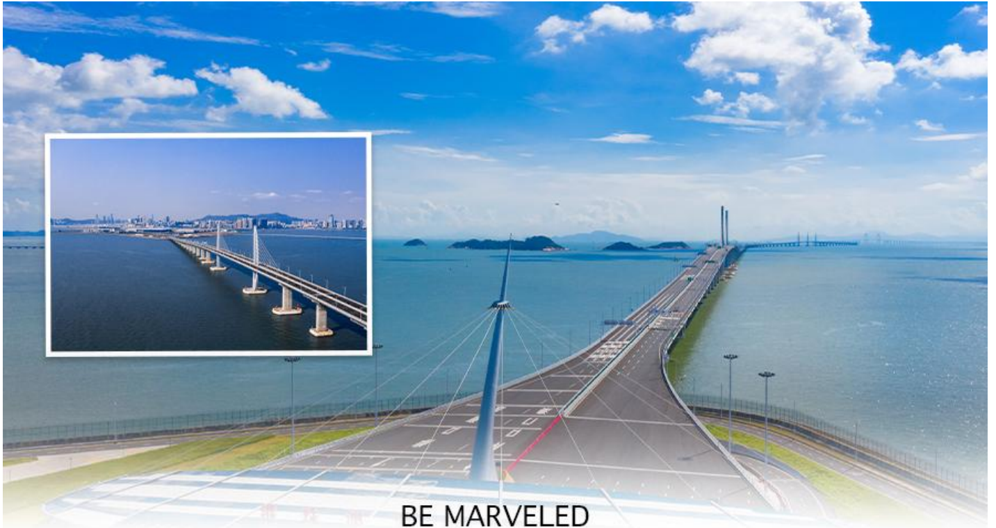
BE MARVELED สะพานข้ามทะเล อ่าวกง มาเก๊า จูไห่ HZMB

เข้ากับเมืองสำคัญในย่านเกรทเทอร์เบย์ และเมืองอื่น ๆ ของเขตกว่างสี นักท่องเที่ยวสามารถนั่งรถบัสซึ่งเชื่อมต่อฮ่องกงจากฝั่งหนึ่งกับเมืองจูไห่และมาเก๊าในอีกฝั่งหนึ่ง พร้อมชมวิวยุทธศาสตร์ตลอดเส้นทาง