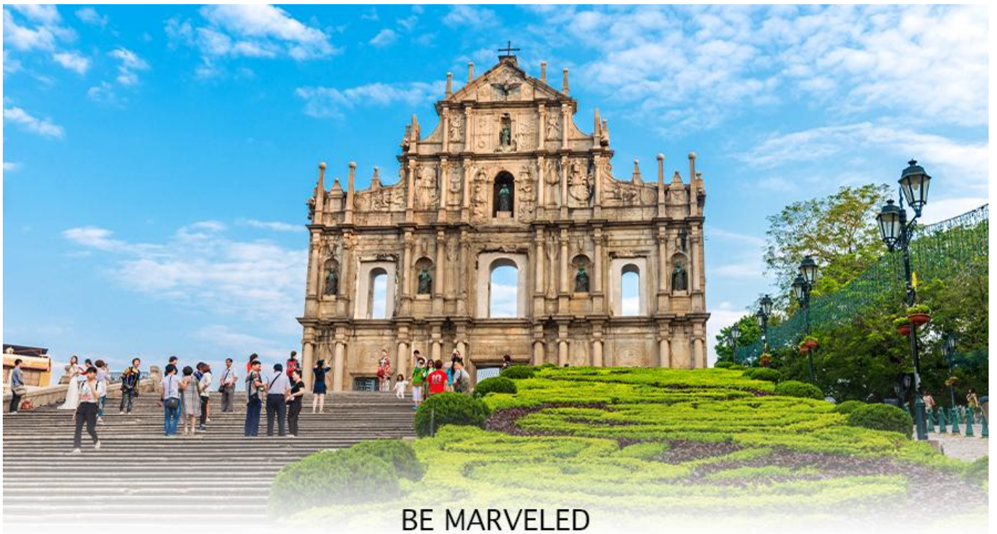
BE MARVELED โบสถ์เซนต์ปอล มาเก๊า

หลังจากนั้นทำทุกท่านเดินทางไปยัง ซากประตูโบสถ์เซนต์ปอล คือด้านหน้าของโบสถ์มาแตร์ เดอีที่ถูกก่อสร้างขึ้นในปี ค.ศ. 1602 – ค.ศ. 1640 ที่ถูกทำลายจากเหตุการณ์ไฟไหม้ในปี ค.ศ. 1835 และซากของวิทยาลัยเซนต์ปอลที่อยู่ถัดไปจากโบสถ์ ทั้งโบสถ์มาแตร์ เดอีเดิม วิทยาลัยเซนต์ปอล และป้อมปราการเป็นสิ่งปลูกสร้างของพระนิกายเยซูอิต และเข้าใจว่าเป็น “ป้อมปราการ” ของมาเก๊า ใกล้เคียง กันนั้นคือซากโบราณสถานของวิทยาลัยเซนต์ปอลที่เป็นหลักฐานของมหาวิทยาลัยแบบตะวันตกแห่งแรกในตะวันออกไกลที่มีหลักสูตรการสอนที่ละเอียด ทุกวันนี้ด้านหน้าของซากประตูโบสถ์เซนต์ปอลทำหน้าที่เป็นสัญลักษณ์ของแทนบูชาให้กับเมืองนี้