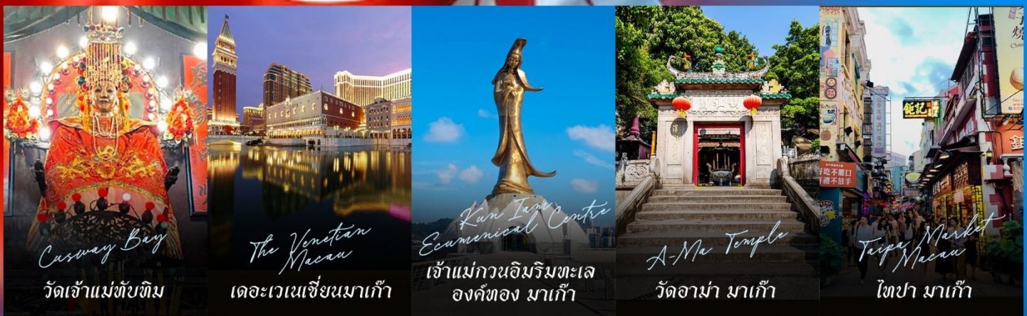
Casway Bay วัดเจ้าแม่ทับทิม

รายการทัวร์ข้างต้นอาจมีการปรับเปลี่ยนเพื่อความเหมาะสม