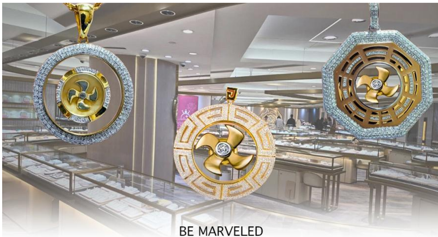
BE MARVELED ศูนย์จิวเวลรี่ กังหันเศรษฐี

เป็นเครื่องประดับ ไม่ว่าจะ เป็น จี้, แหวน, กำไล หรือต่างหู เพื่อเป็นเครื่องประดับติดตัว และเสริมดวงชะตา ซึ่ง สินค้าทุกชนิด มีเอกสาร รับประกันคุณภาพเปลี่ยน หรือ ซ่อม ได้ตลอดอายุการใช้งาน หากเกิดการชำรุดจากสินค้า ไม่ใช่อุบัติเหตุ