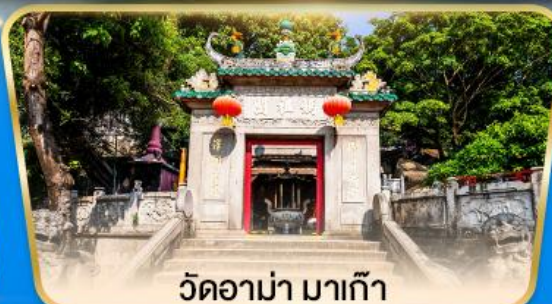
วัดอามา มาเก๊า