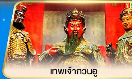
เทพเจ้ากวนอู