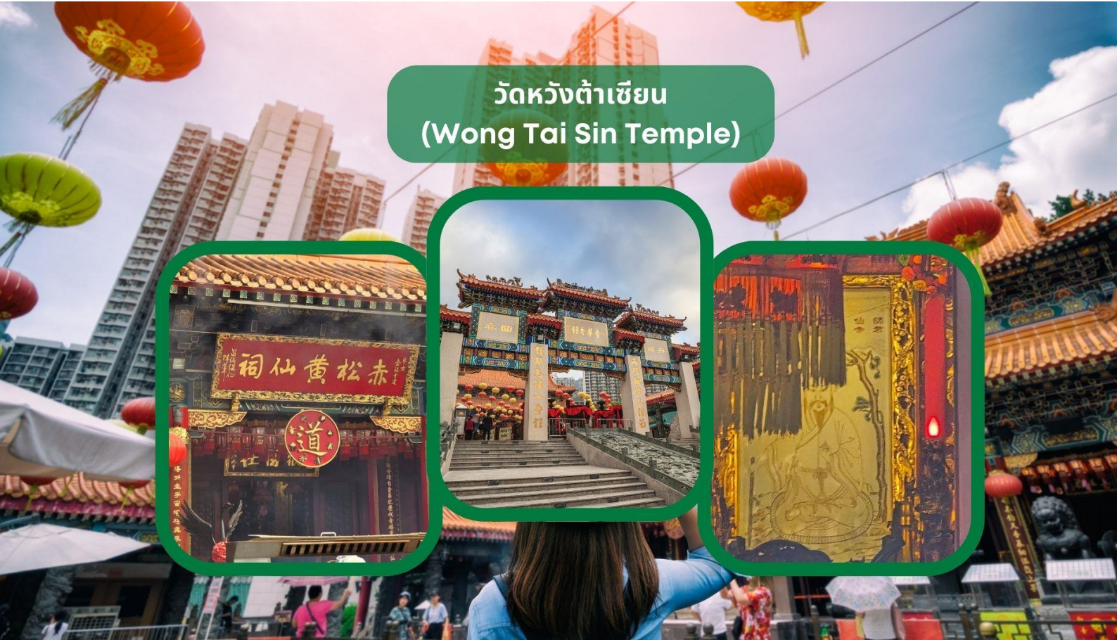
วัดหวังต้าเซียน (Wong Tai Sin Temple)

ในช่วงเช้าอิสระให้ท่านพักผ่อนตามอัธยาศัย เพื่อเติมเต็มความสดชื่นก่อนออกเดินทางท่องเที่ยว