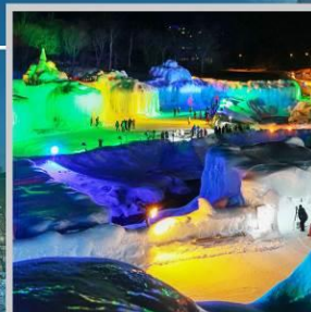
“SOUNKYO ICE FEST”