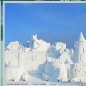
“ASAHIKAWA SNOW FEST”