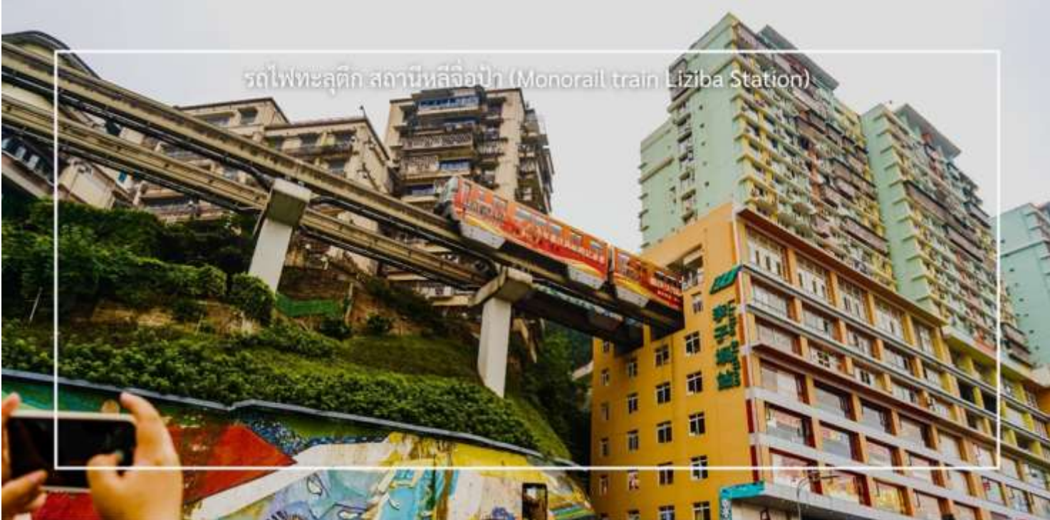
รถไฟฟ้าลัดราง สถานีลิซ่าป้า (Monorail train Liziba Station)