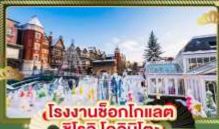
โรงงานช็อกโกแลต ชิโรอิ โคอิบิโตะ