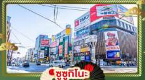
ซูซุกิโมะ