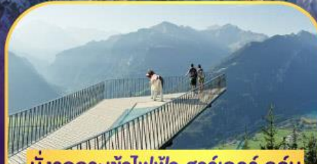
นั่งรถกระเช้าไฟฟ้า ชาร์เตอร์ คูล์ม