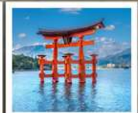
ศาลเจ้าอิตสึคุชิมะ