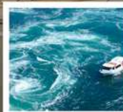
คลองเรือขมบ้านนาสุโตะ

คลองเรือขมบ้านนาสุโตะ / ซุปป์งย่านชินโซบาช / ตลาดปลาคุโรเมง / ซุปป์งย่านอุเมะ