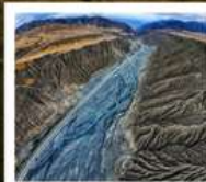
แกรนด์แคนยอนตู้ซานจื่อ