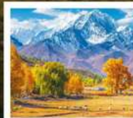
ทุ่งหญ้านาราที

ทัวร์คุณธรรม ไม่ลงร้านช้อปปิ้ง ไม่ขายออฟชั่น