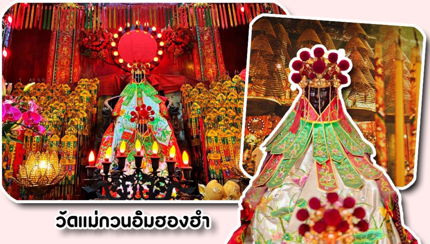
วัดแม่กวนอิมฮ่องฮ่า

พาท่านเดินทางไปที่ ไหว้ขอพรขอเงิน วัดแม่กวนอิมฮ่องฮ่า วัดเก่าแก่ของฮ่องกงสร้างตั้งแต่ปี ค.ศ. 1873 เป็นวัดขนาดเล็กที่มีชาวฮ่องกงศรัทธาแน่นถือกันเป็นอย่างมาก วัดแห่งนี้เป็นที่ประดิษฐาน องค์เจ้าแม่กวนอิมฮ่องฮ่า ที่มีชื่อเสียงเรื่องการให้กู้ยืมเงิน เชื่อกันว่าท่านช่วยพลิกฟื้นเศรษฐกิจของชาวฮ่องกง ผู้คนจึงนิยมมาขอยืมเงินทำธุรกิจจนสำเร็จร่ำรวย รุ่งเรือง โดยให้ท่านอธิษฐานขอพรต่อหน้าเจ้าแม่กวนอิมฮ่องฮ่า พร้อมกับระบุวันเวลาในการขอพรด้วย จากนั้นนำธูปธบายตามฐานะและศรัทธาที่เราจะนำเป็นสื่อในการขอพร เขียนจำนวนเงินที่ต้องการลงไปด้วย ใส่สกุลเงินยี่งดีใหญ่ แล้วนำเงินใส่ในซองแดง ควรเตรียมซองแดงไปเอง นำซองแดงไปวางรอบกระถางรูป วนขวาจำนวน 3 ครั้ง แล้วเก็บซองแดงในกระเป๋าสตางค์ เป็นเงินขวัญถุง ถ้าประสบความสำเร็จตามที่มุ่งหวัง ให้นำเงินในซองแดงทำบุญหยอดตู้ที่วัดแห่งนี้ในโอกาสต่อไป วิธีไหว้ให้ปัง ให้ได้โชคลาภเงินทอง ต้องไปกับเราเท่านั้น