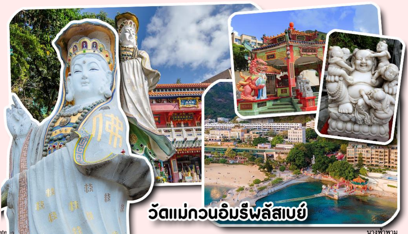
วัดแม่กวนอิมรีพลัสเบย์

จากนั้นพาท่านเดินทางไปนมัสการ เจ้าแม่กวนอิมริมหาดรีพลัสเบย์ วัดแห่งนี้ถูกสร้างขึ้นเพื่อคุ้มครองชาวประมงเวลาออกเรือไปหาปลาในสมัยก่อน บริเวณวัดมีสิ่งศักดิ์สิทธิ์มากมาย ได้แก่ เจ้าแม่กวนอิม ประดิษฐานอยู่ทางด้านซ้ายของวัด ซึ่งผู้คนนิยมเดินทางไปกราบไหว้ขอพรเรื่องการมีบุตร และยังมีพระสังกัจจายที่เชื่อกันว่าสามารถขอเพศของบุตรที่จะมาเกิดได้ โดยหลังจากกราบไหว้แล้วก็ให้ลูบที่ท้องของพระสังกัจจาย ถ้าอยากได้ลูกชายให้ลูบท้องซ้าย อยากได้ลูกสาวให้ลูบท้องขวา ถัดมาคือ เจ้าแม่ทับทิมเทพีแห่งท้องทะเล ท่านจะคอยคุ้มครองผู้เดินทางทางเรือ หรือผู้ที่เดินทางไปไหนมาไหนท่านจะคอยคุ้มครองให้ปลอดภัย และมีโชคลาภ ถัดจากบริเวณที่กราบไหว้ขอพร ก็จะมีศาลาแปดเหลี่ยมริมน้ำ และสะพานเล็กๆ ที่ชื่อว่าสะพานต่ออายุ ซึ่งเชื่อกันว่าหากเดินข้ามสะพานแห่งนี้ 1 ครั้ง ก็จะมีอายุยืนขึ้น 3 ปี