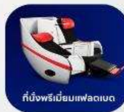
ที่นั่งพรีเมียมแพซิฟิก