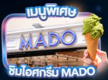
ชิมไอศกรีม MADO