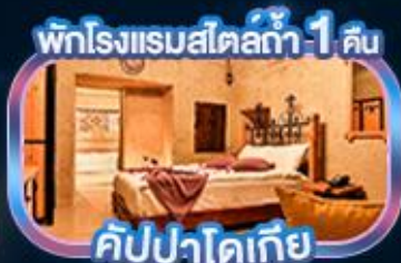
คิปปาโดเทีย