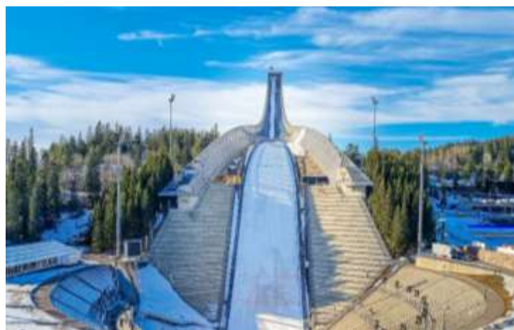
HOLMENKOLLEN SKI JUMP