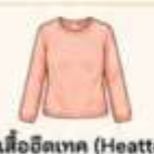
สวมเสื้อฮีตเทค (Heattech) ไว้ด้านในเพื่อเพิ่มความอบอุ่น แทนการใส่เสื้อหนาๆ หลายชั้น