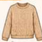
เสื้อไหมพรม