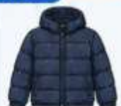
เสื้อขนเป็ด