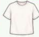
เสื้อยืด