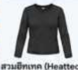
สวมฮีตเทค (Heattech) แบบหนาพิเศษด้านใน