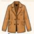
เสื้อแจ็กเก็ต หรือโค้ทตัวยาว