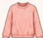
เสื้อสเวตเตอร์ถัก หรือคาร์ดิแกน