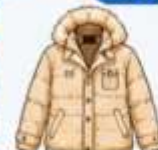
เสื้อโค้ทกันหนาว ตัวหนา